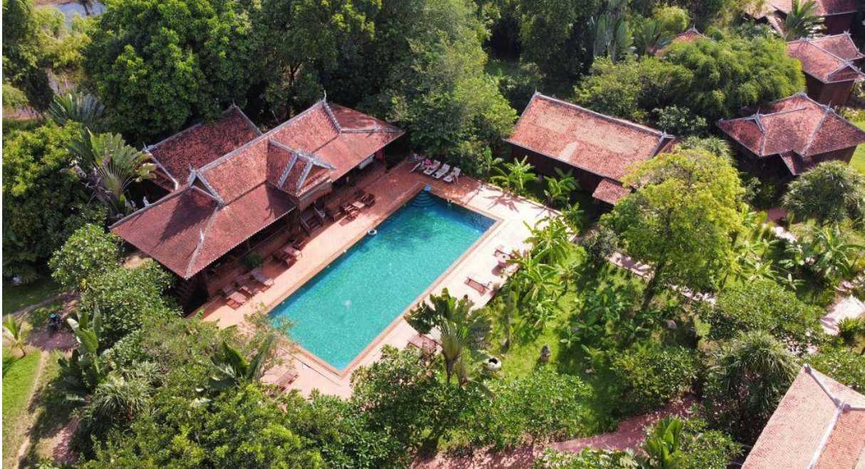
Zelf gemaakte drone foto in Kratie, Cambodja

Fotografie & nieuwe media: Zelf foto's maken vind ik tof en ik houd van mooie foto's bekijken.