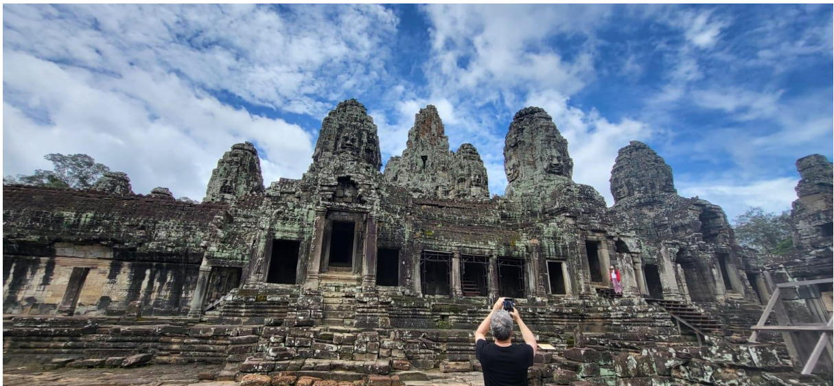
Bayon Temple, Cambodja

Op vakantie gaan we soms naar tempels. Dit maakt altijd veel indruk op me.