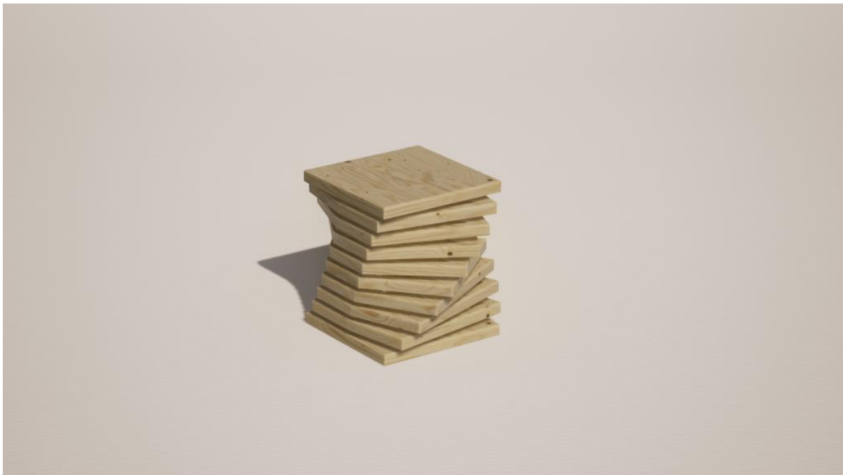
Zelf ontworpen krukje

Het design van meubels en voorwerpen, zoals vazen, spreekt mij aan.