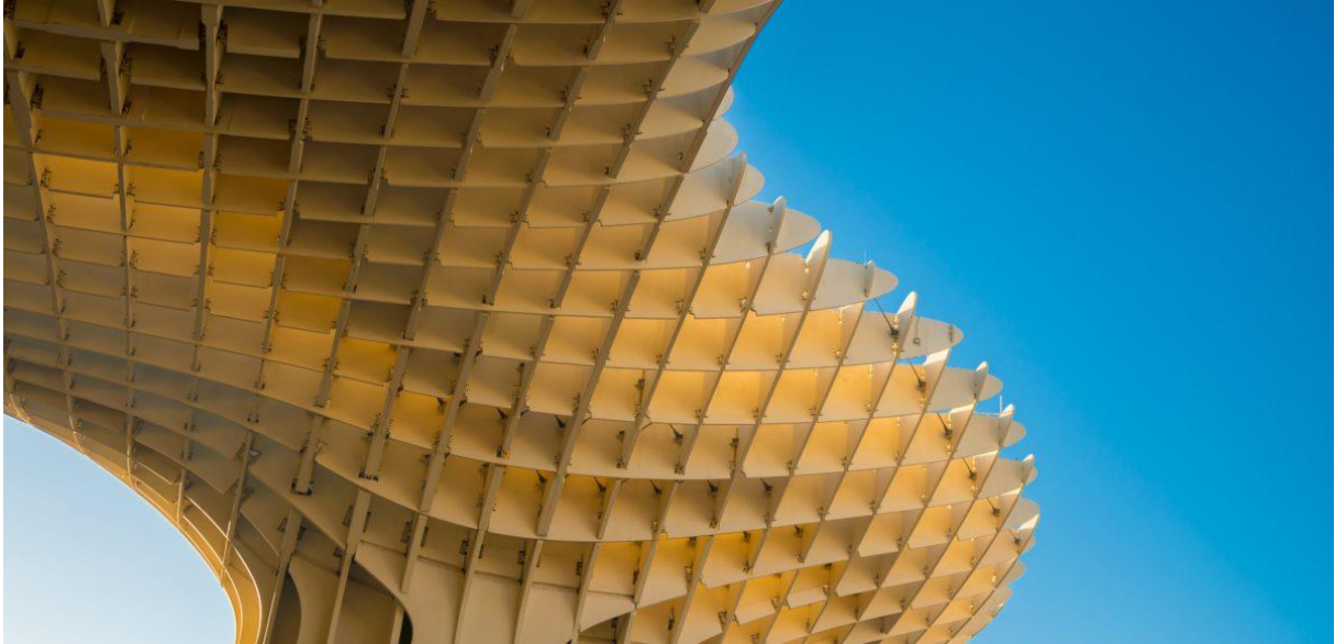
Metropol Parasol in Sevilla

Het idee achter gebouwen vind ik interessant en ik wil later zelf architect worden.