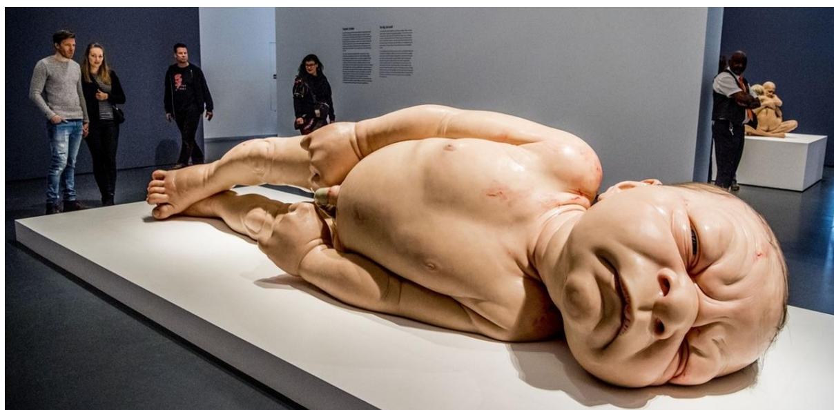
Baby in de tentoonstelling 'Hyperrealisme sculptuur'

Deze baby was een onderdeel van de tentoonstelling 'Hyperrealisme sculptuur' in de Kunsthal. De kunstenaar was Ron Mueck. De reusachtige baby was een vergrote kopie van zijn eigen dochter. Ik weet niet de precieze datum waarop ik deze baby heb gezien, maar de tentoonstelling in de Kunsthal was in 2018 van maart tot juli.